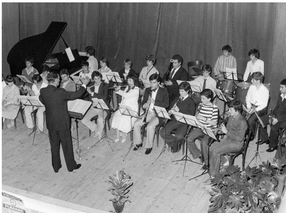
Saggio degli allievi della Scuola Comunale di Musica (1979)

All'inizio degli anni '70 si pose, in maniera indifferibile, la questione del ruolo del Comune nei confronti del Teatro e della necessità di disporre, in maniera continuativa, di una struttura che veniva gestita secondo fini, criteri e interessi che risultavano oggettivamente ed inevitabilmente lontani dalla considerazione della cultura come patrimonio imprescindibile della comunità. Si sentì allora più forte di prima l'esigenza di fornire nuove risposte alle cresciute esigenze culturali della comunità, che si concretizzavano anche nel decentramento teatrale promosso dalla Regione, un periodo d'oro per la prosa in Toscana. Al contrario l'attività del Teatro "si limitava quasi esclusivamente alla programmazione di film come un qualunque cinema", mentre sarebbe stato importante "per la cittadinanza ed in particolare per le numerose associazioni culturali e sociali ... un diverso sistema di gestione volto a tenere nel debito conto le esigenze di tali organismi nonché quelle del civico ente che svolge un'intensa attività nel campo della cultura, della scuola, della musica, ecc."