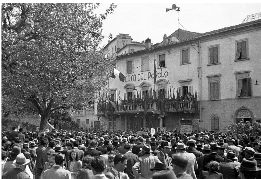
Manifestazione davanti al Teatro (1948)

Dal 1947 iniziò una contrapposizione tra l'Accademia degli Operosi Impazienti (che riuniva i proprietari dei palchi) e il Comune, il quale, pur essendo il socio con il maggior numero di palchi - frutto di donazioni e di acquisizioni - era di fatto impossibilitato ad intervenire nella gestione, essendo irrisolta, per quelle che furono definite "le modalità patriarcali dello Statuto", la questione delle deleghe in sede assembleare, occasione peraltro di una serie interminabile di contenziosi legali, ricorsi, sentenze contrastanti.