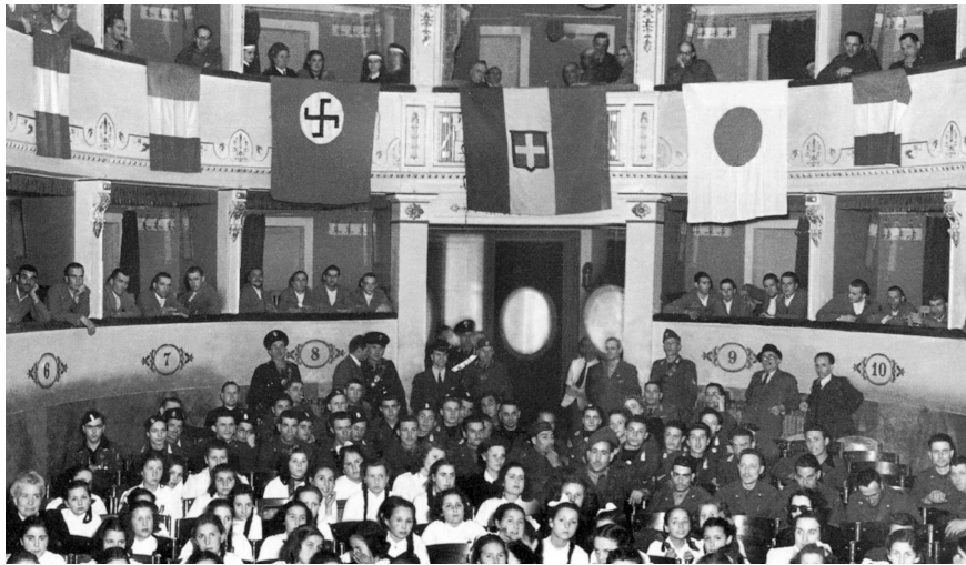
Una manifestazione del regime fascista (1942)

dell'architetto futurista Virgilio Marchi, il quale, oltre a migliorare l'acustica, la visibilità, il palcoscenico, rinnovando l'illuminazione, gli arredi e i decori, costruì il loggione: dopo questo intervento il Teatro non ne ebbe altri significativi fino agli anni '60. Nel 1934 il Partito Fascista si appropriava dei locali del Ridotto, divenuti sede della Casa del Fascio.